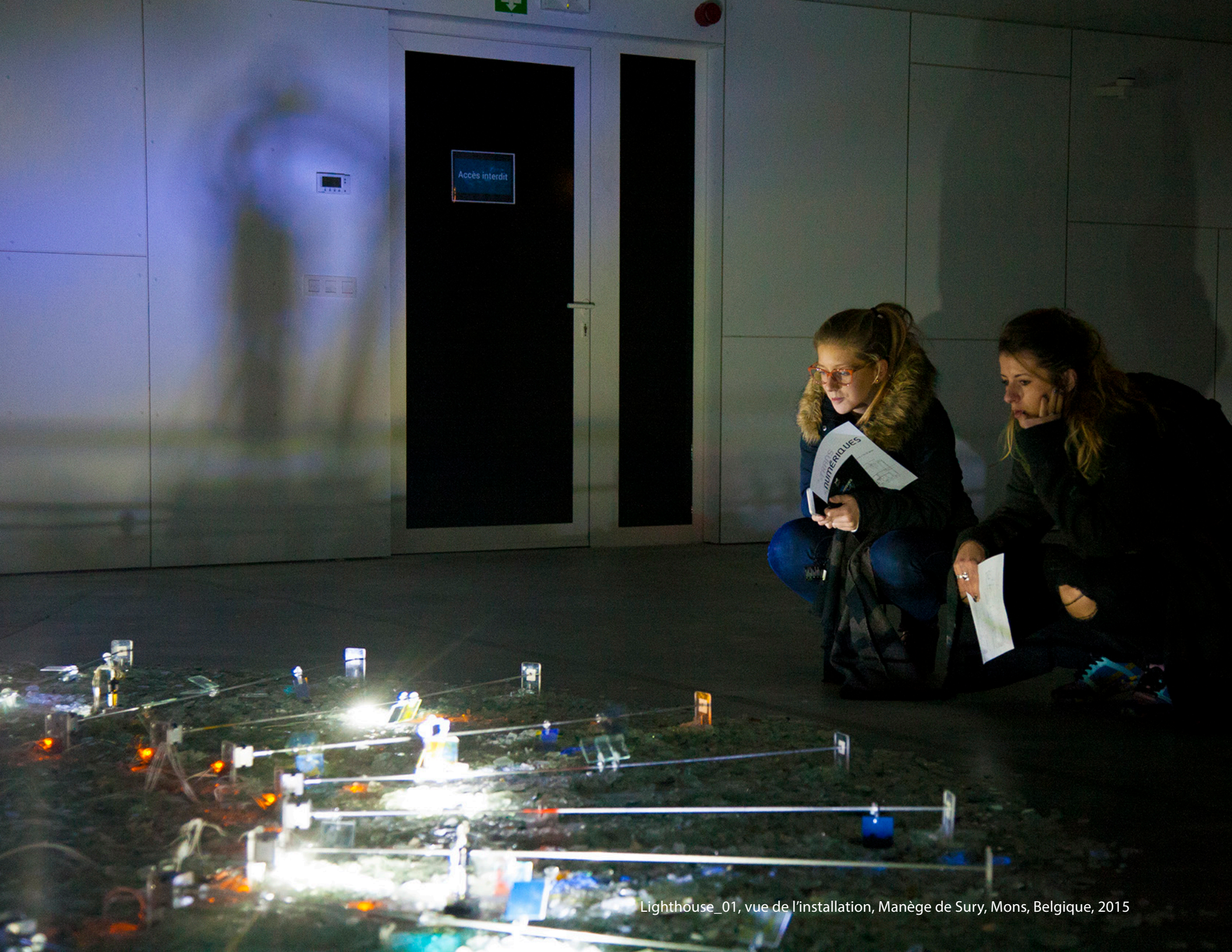
Lighthouse_01, vue de l'installation, Manège de Sury, Mons, Belgique, 2015