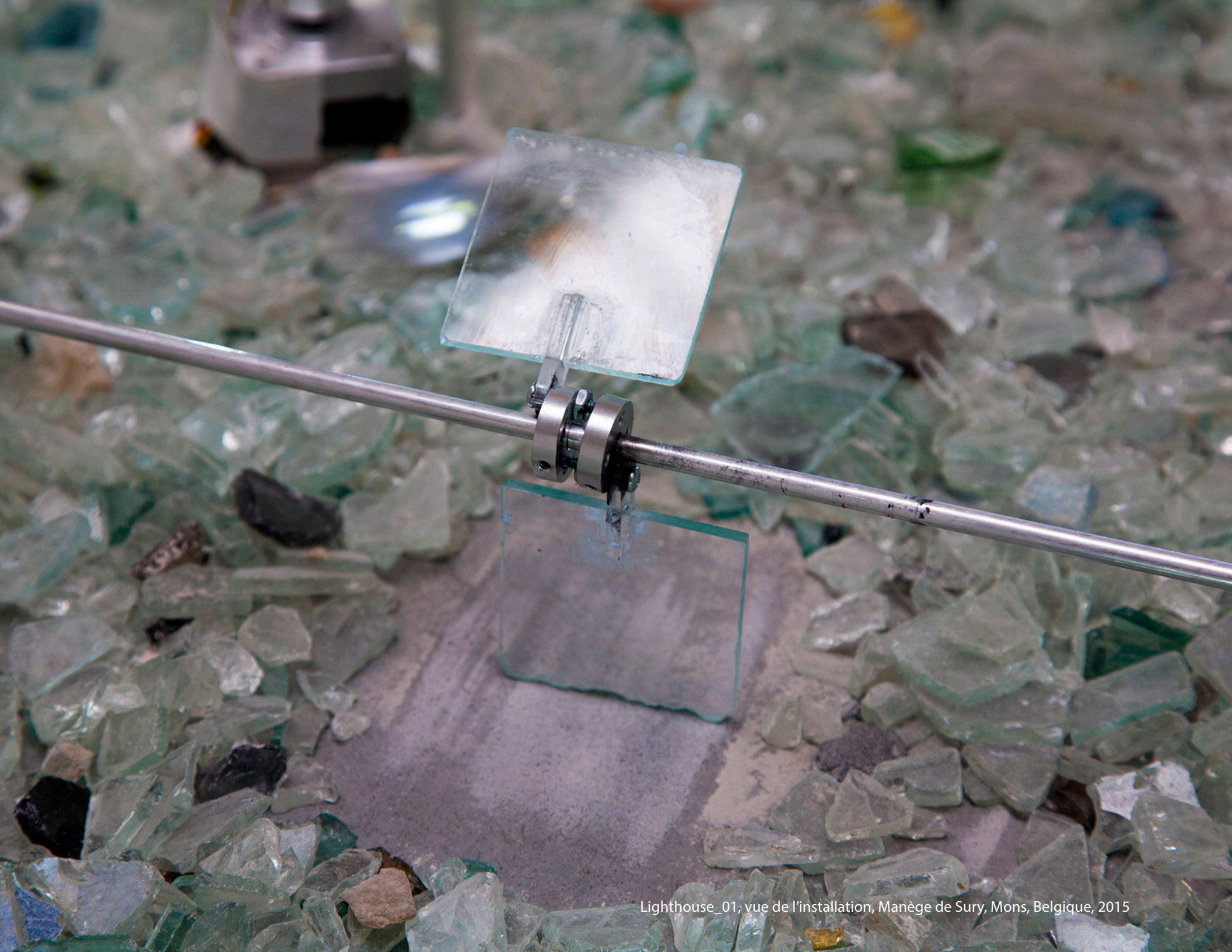
Lighthouse_01; vue de l'installation, Manège de Sury, Mons, Belgique, 2015