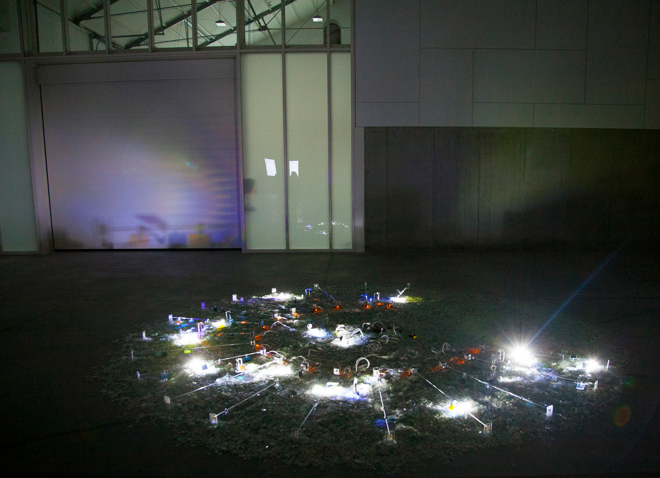
Lighthouse_01, vue de l'installation, Manège de Sury, Mons, Belgique, 2015