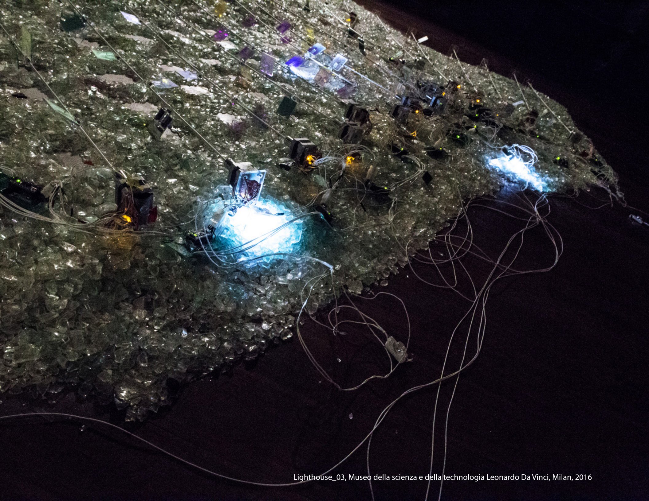
Lighthouse_03, Museo della scienza e della tecnologia Leonardo Da Vinci, Milan, 2016