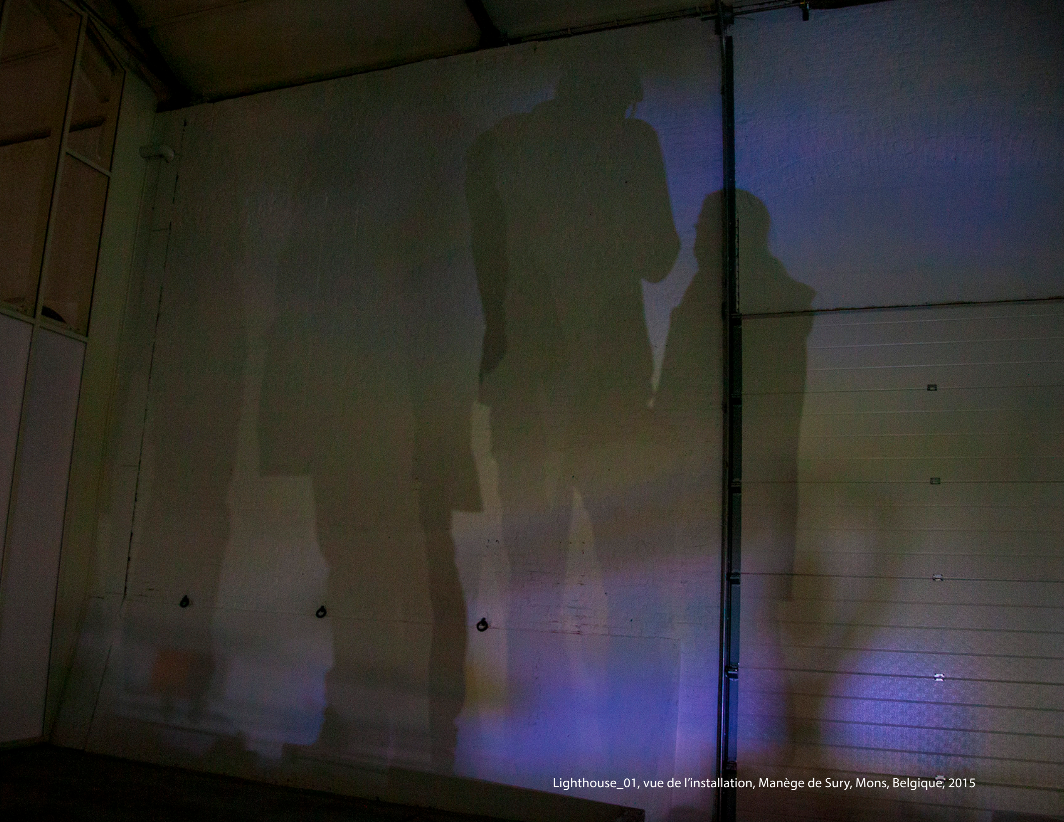
Lighthouse_01, vue de l'installation, Manège de Sury, Mons, Belgique, 2015