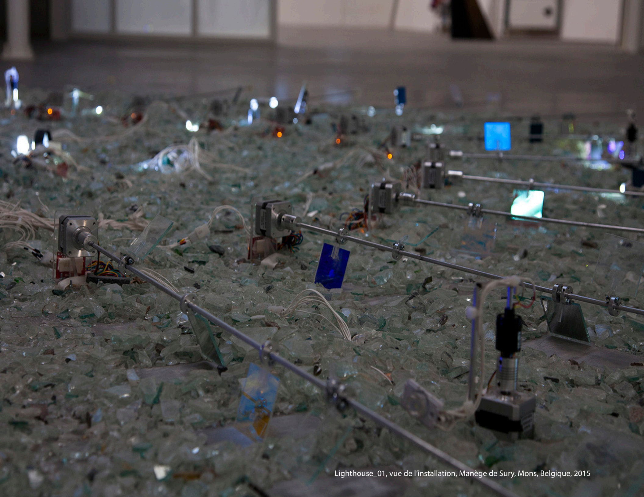
Lighthouse_01, vue de l'installation, Manège de Sury, Mons, Belgique, 2015