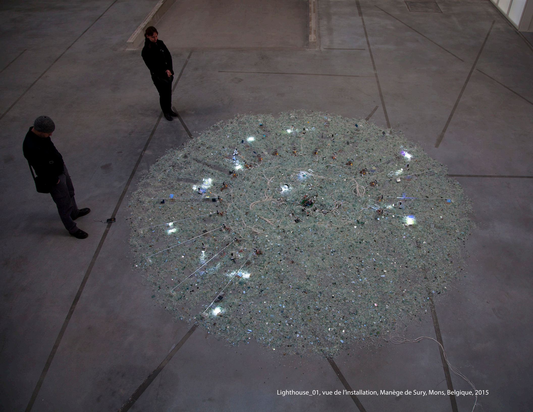
Lighthouse_01, vue de l'installation, Manège de Sury, Mons, Belgique, 2015