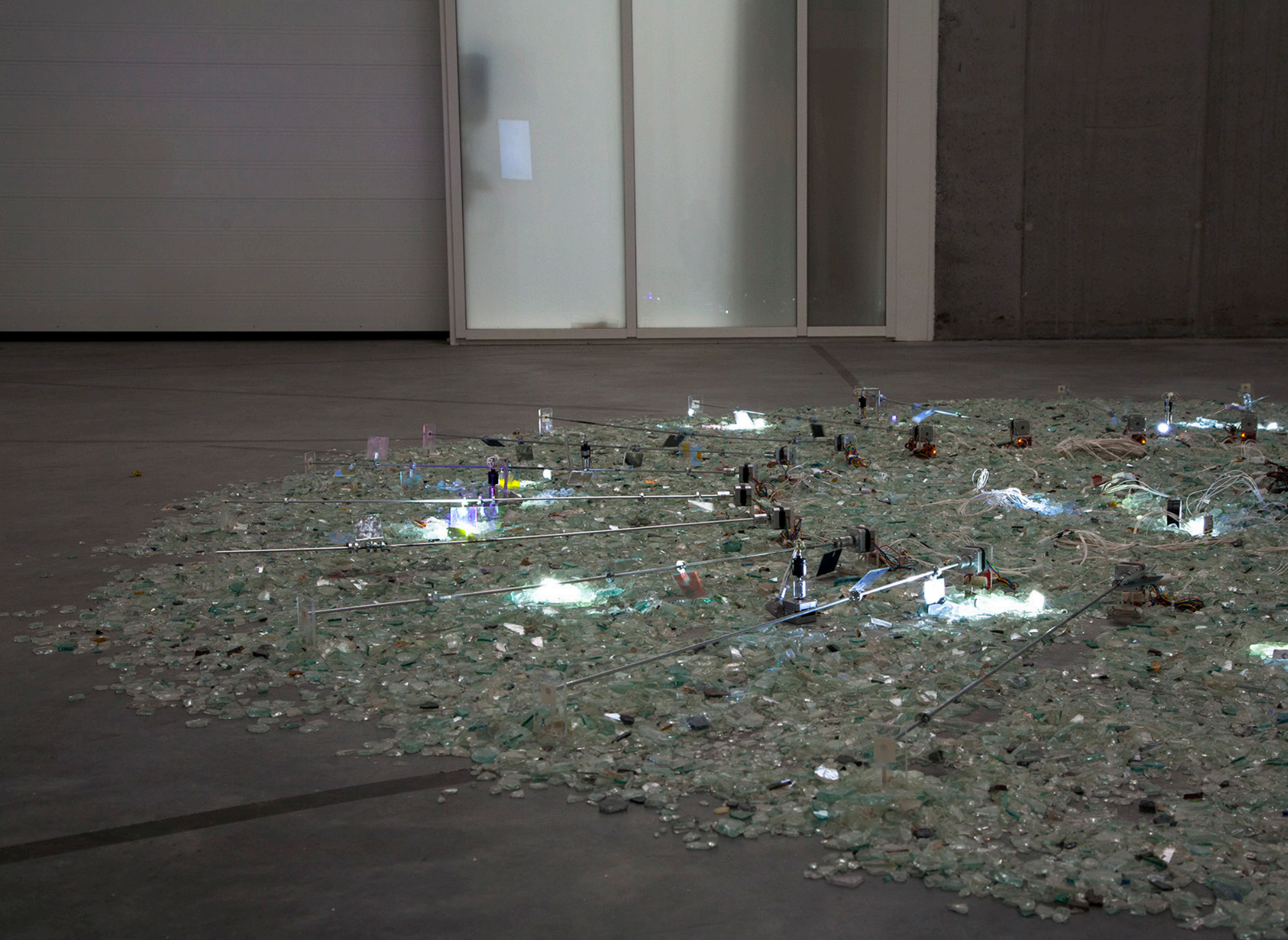
Lighthouse_01, vue de l'installation, Manège de Sury, Mons, Belgique, 2015