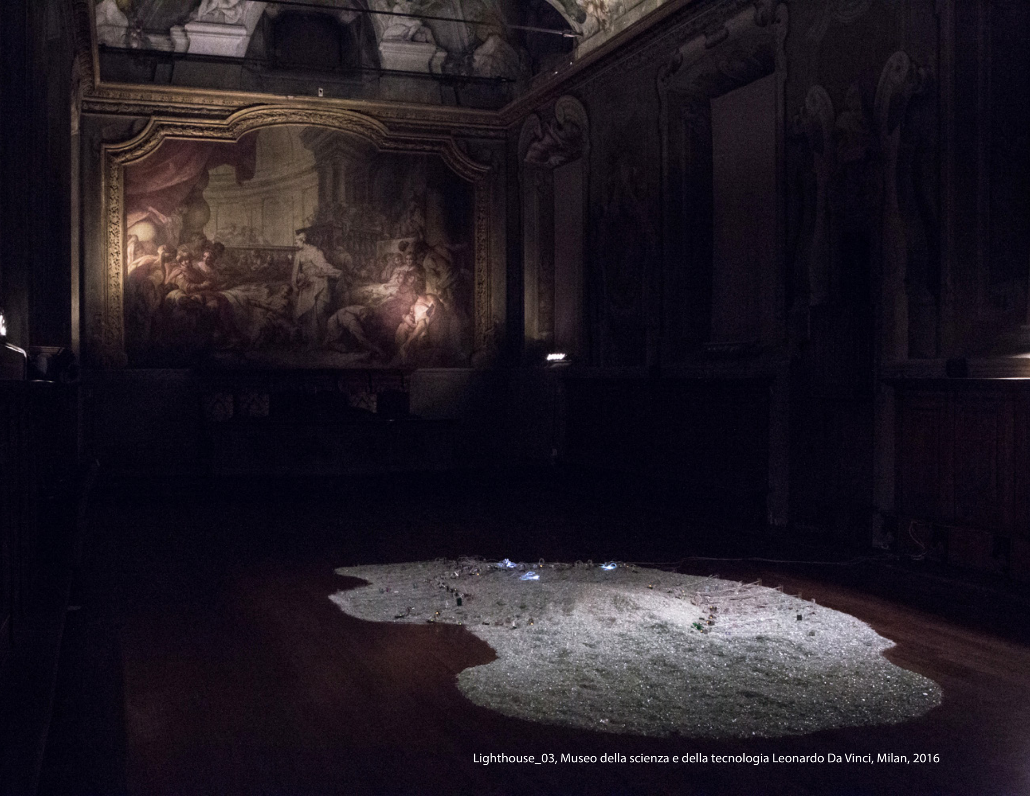
Lighthouse_03, Museo della scienza e della tecnologia Leonardo Da Vinci, Milan, 2016