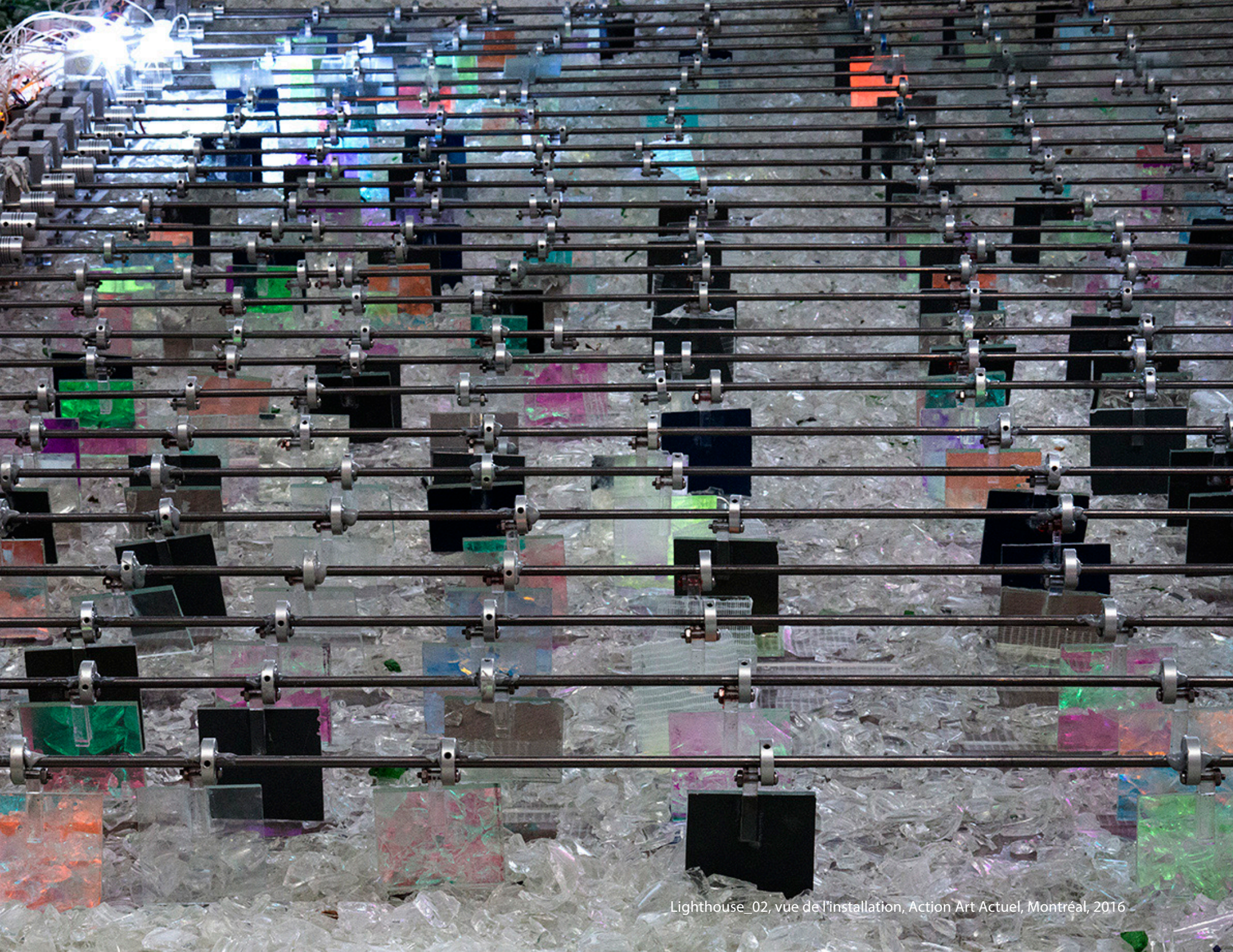
Lighthouse_02, vue de l'installation, Action Art Actuel, Montréal, 2016