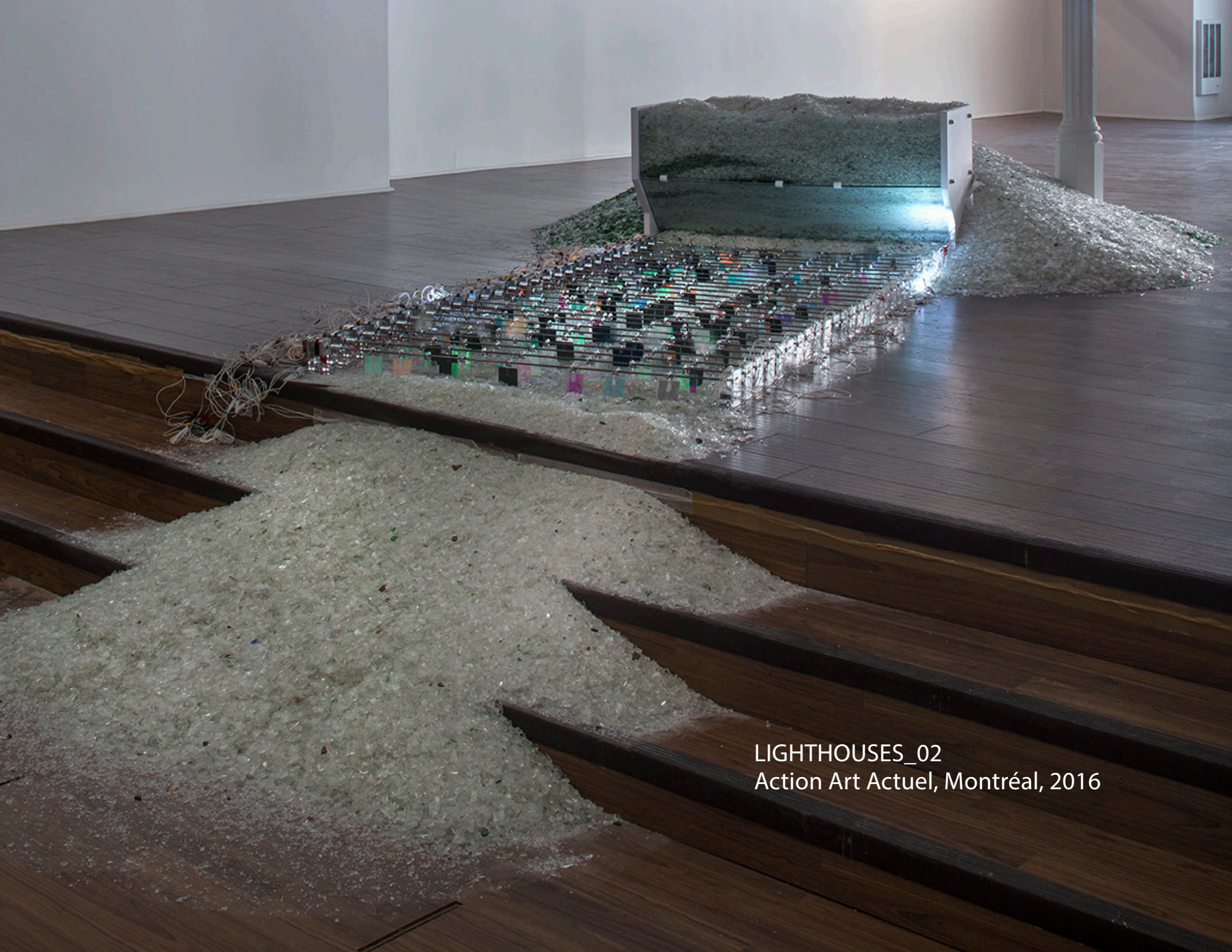
LIGHTHOUSEES_02 Action Art Actuel, Montréal, 2016