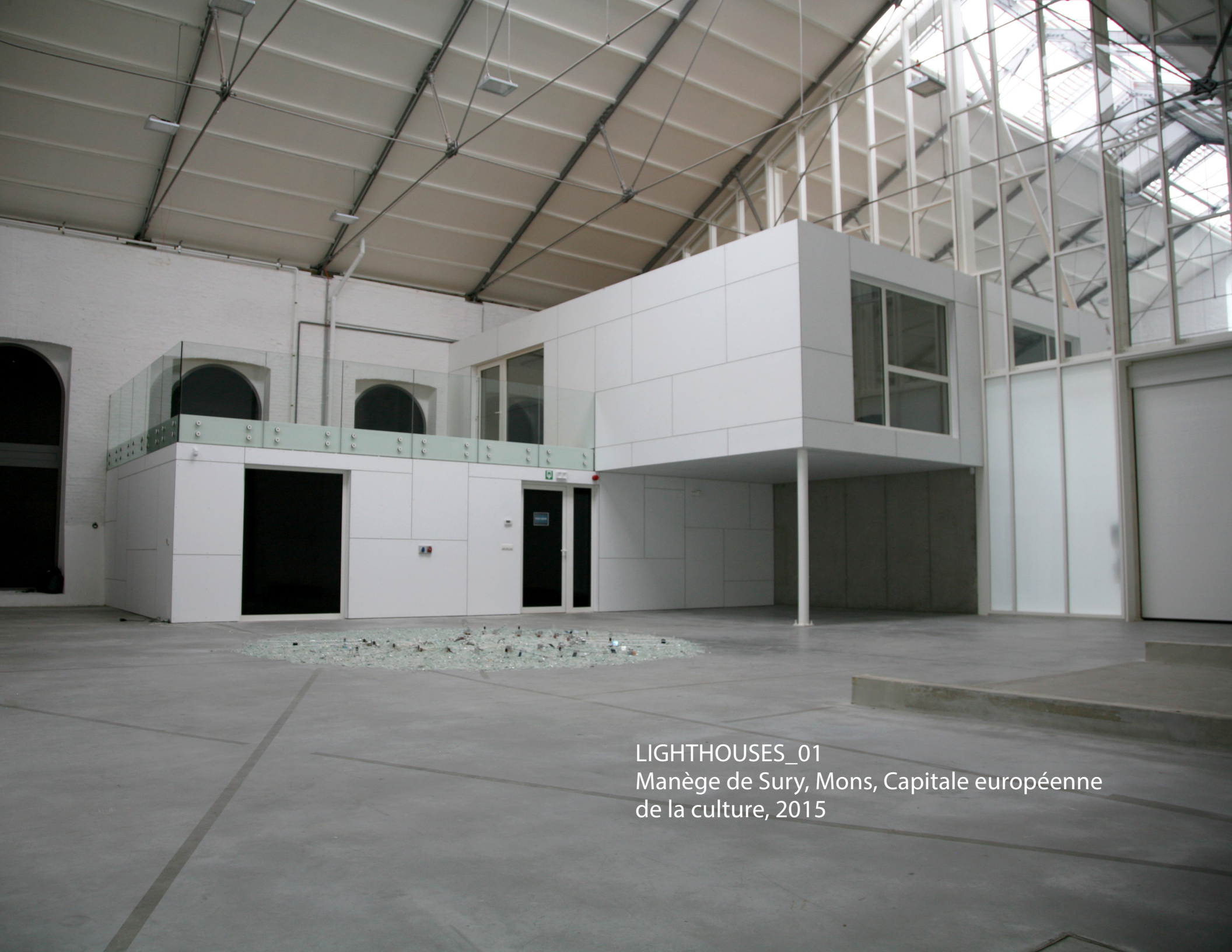
LIGHTHOUSES_01 Manège de Sury, Mons, Capitale européenne de la culture, 2015