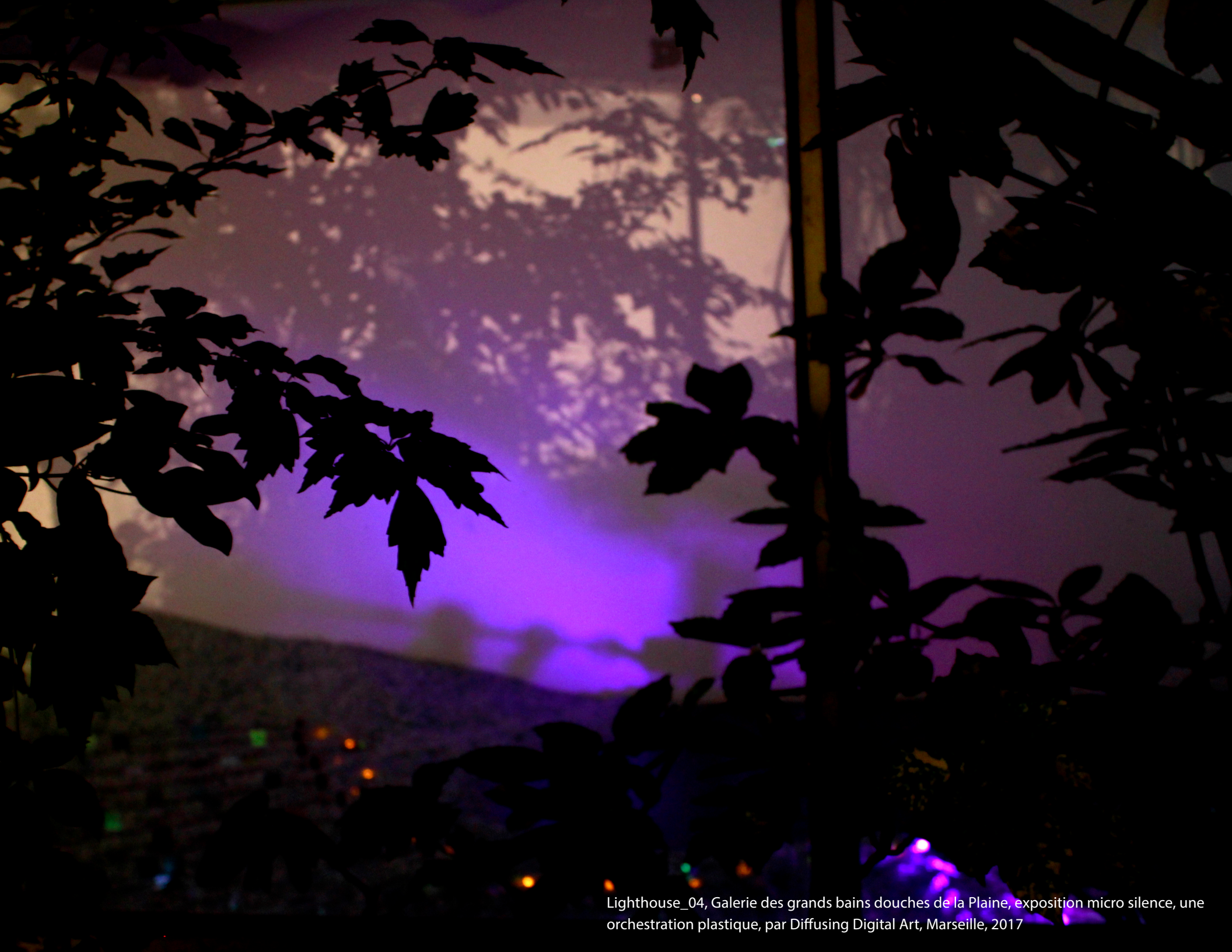
Lighthouse_04, Galerie des grands bains douches de la Plaine, exposition micro silence, une orchestration plastique, par Diffusing Digital Art, Marseille, 2017