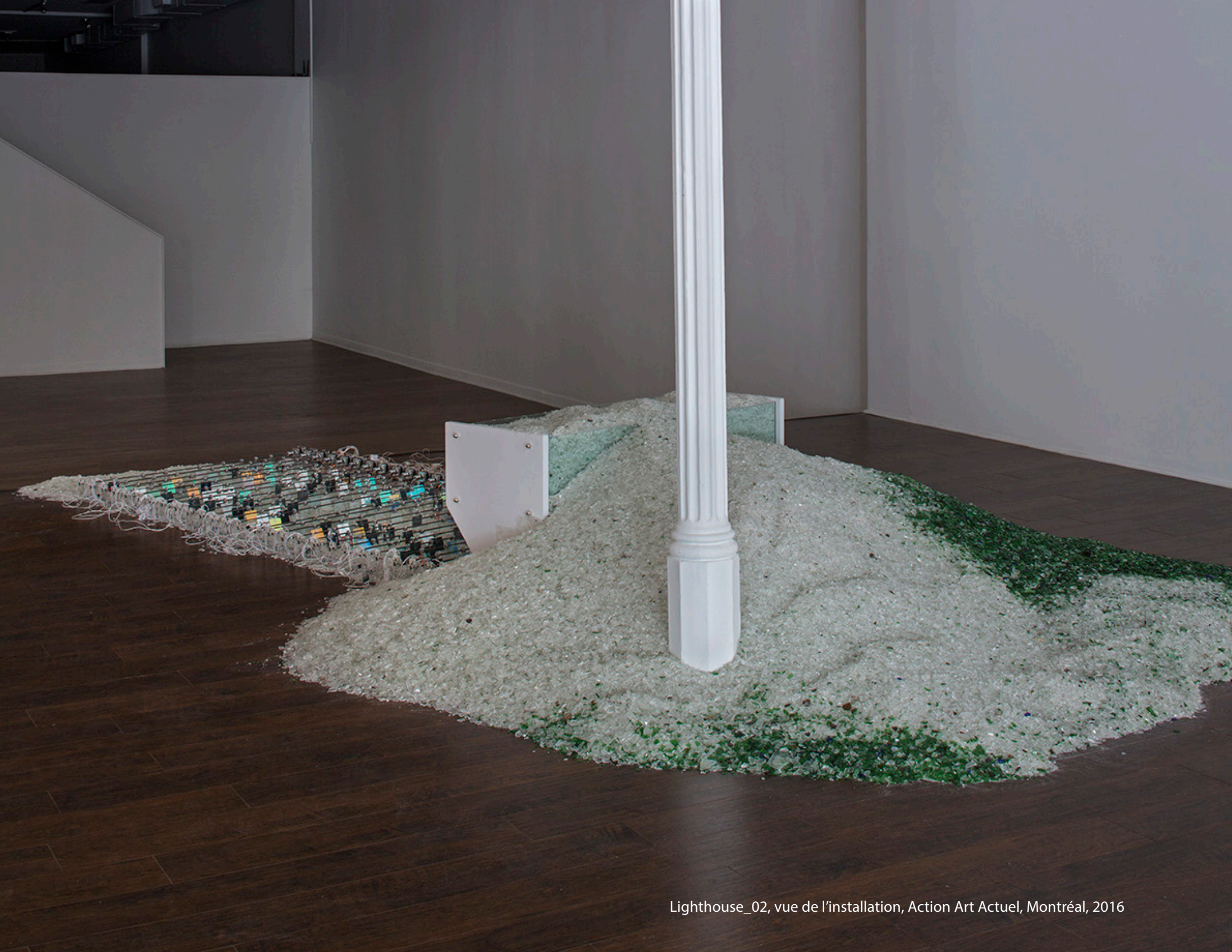
Lighthouse_02, vue de l'installation, Action Art Actuel, Montréal, 2016