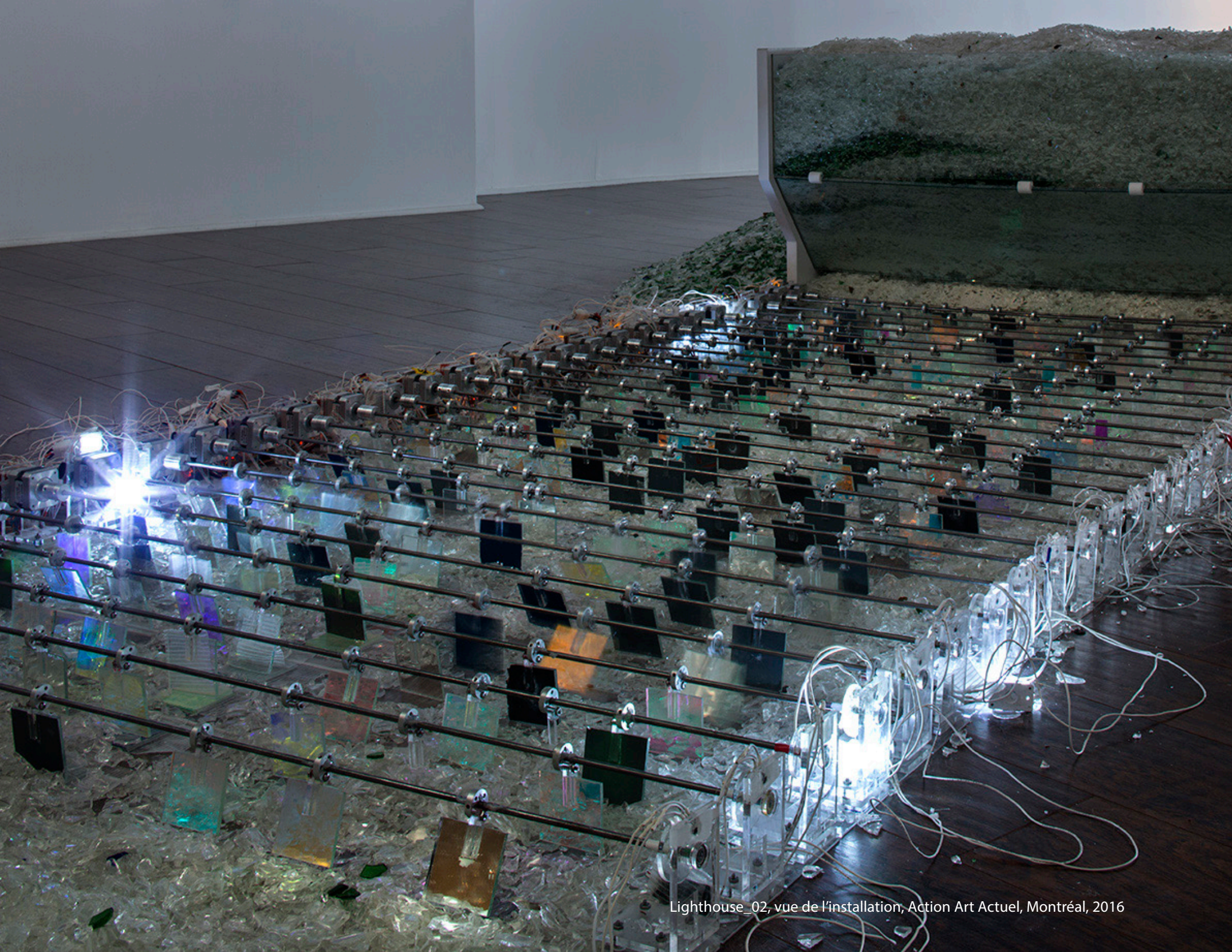
Lighthouse_02, vue de l'installation, Action Art Actuel, Montréal, 2016