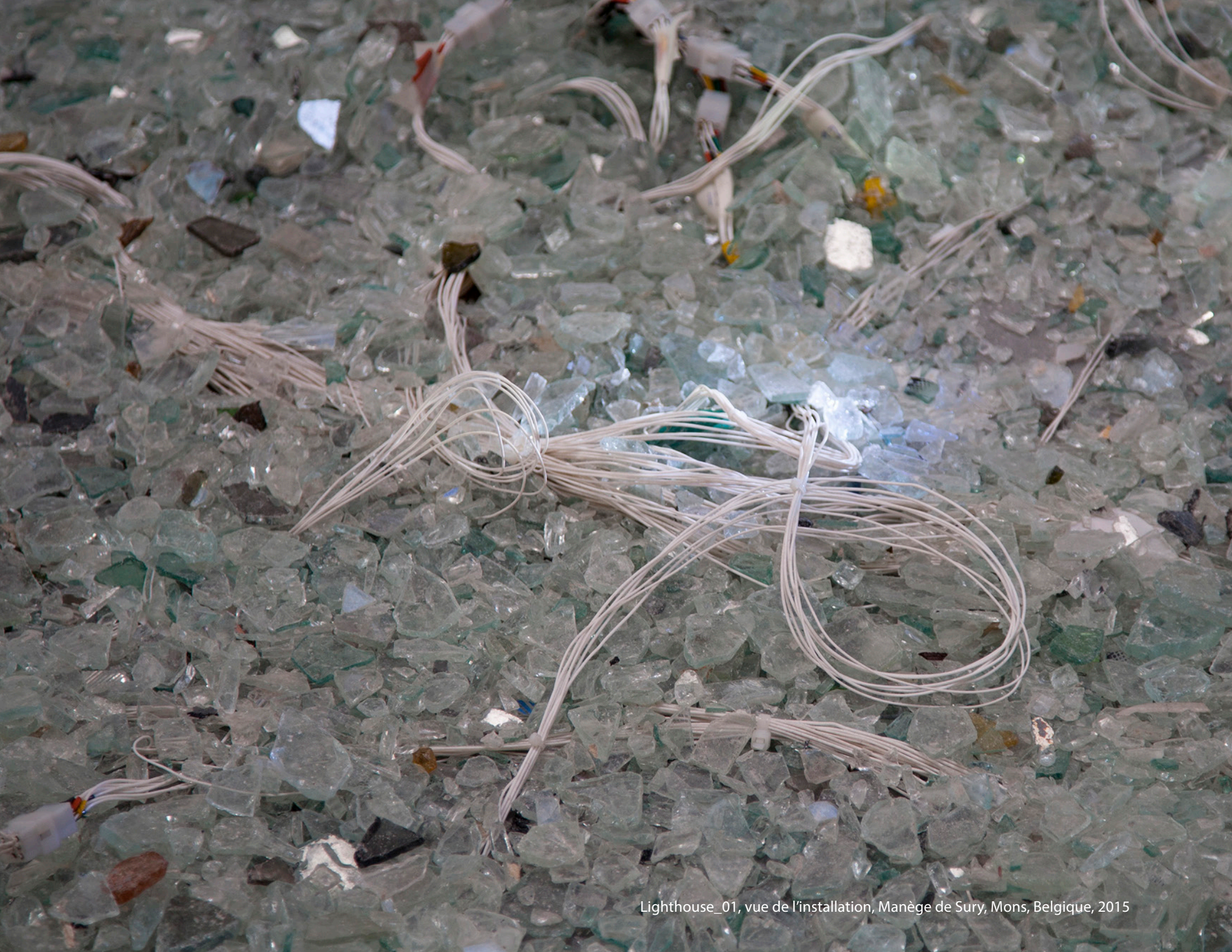
Lighthouse_01, vue de l'installation, Manège de Sury, Mons, Belgique, 2015