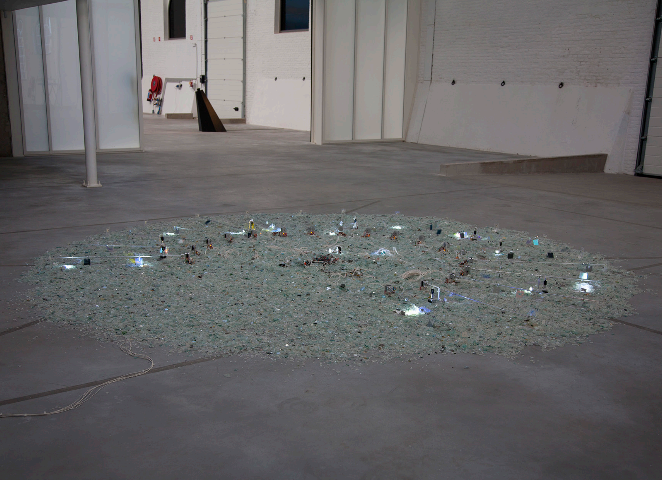
Lighthouse_01, vue de l'installation, Manège de Sury, Mons, Belgique, 2015