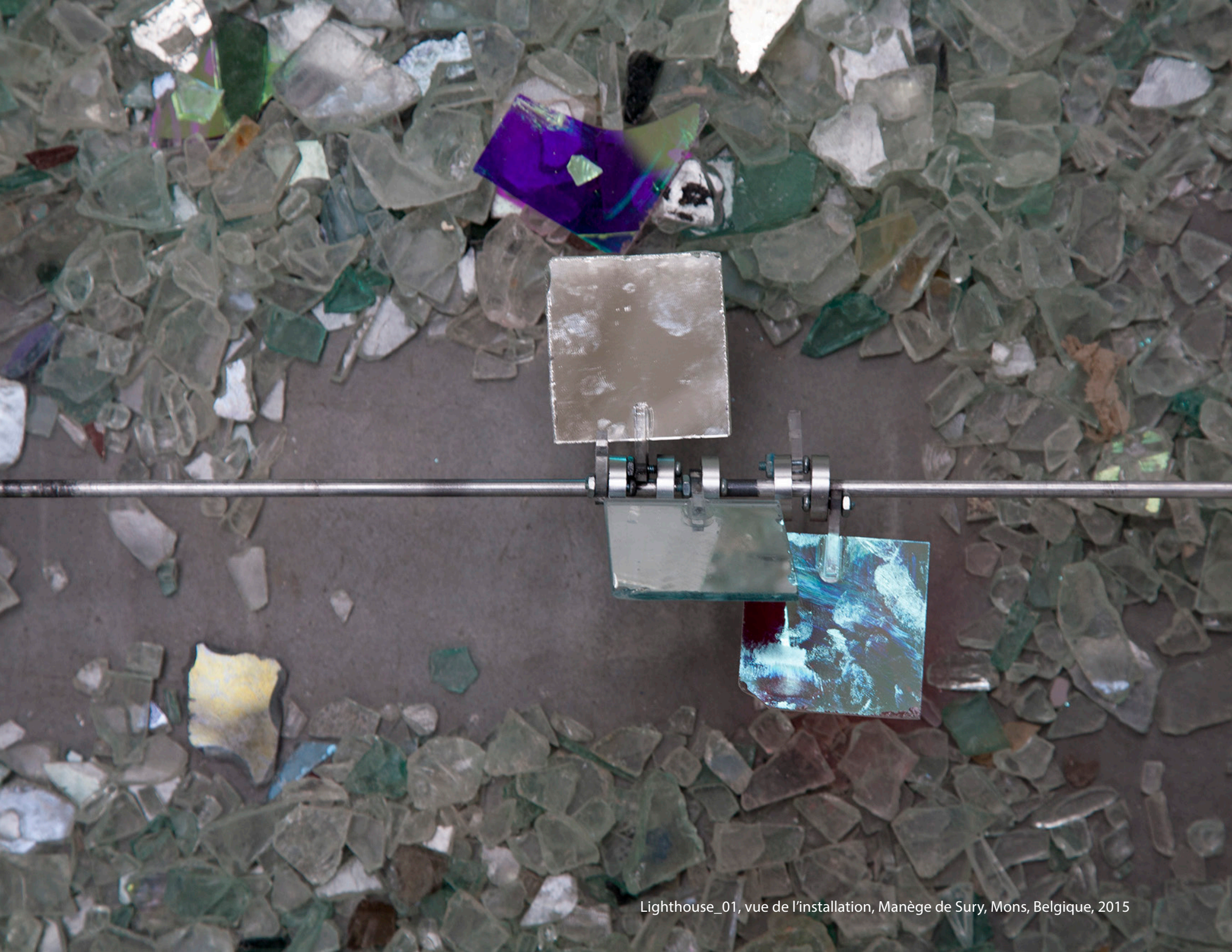
Lighthouse_01, vue de l'installation, Manège de Sury, Mons, Belgique, 2015