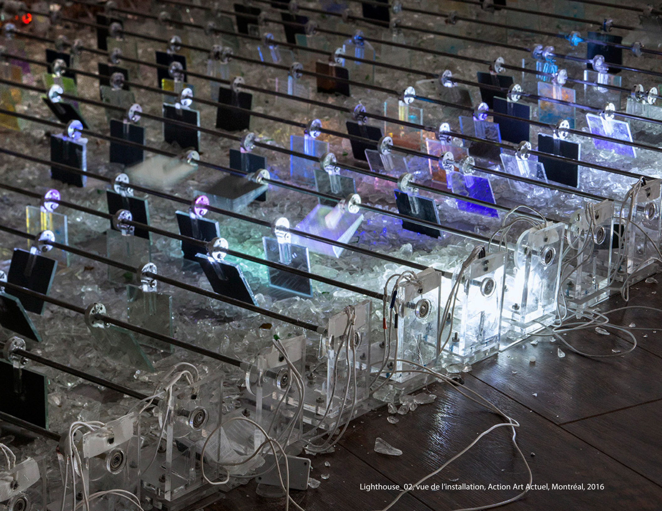
Lighthouse_02, vue de l'installation, Action Art Actuel, Montréal, 2016