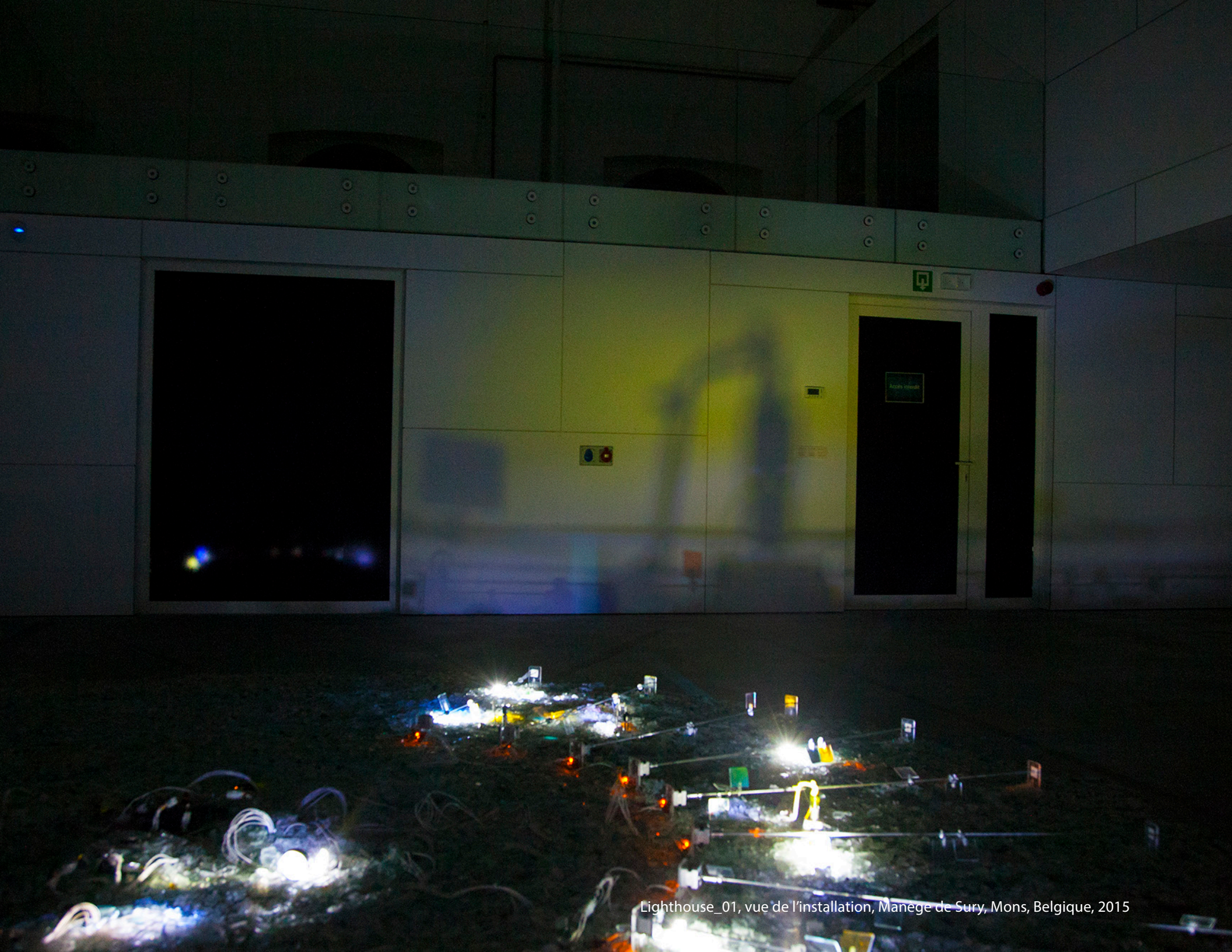
Lighthouse_01, vue de l'installation, Manège de Sury, Mons, Belgique, 2015