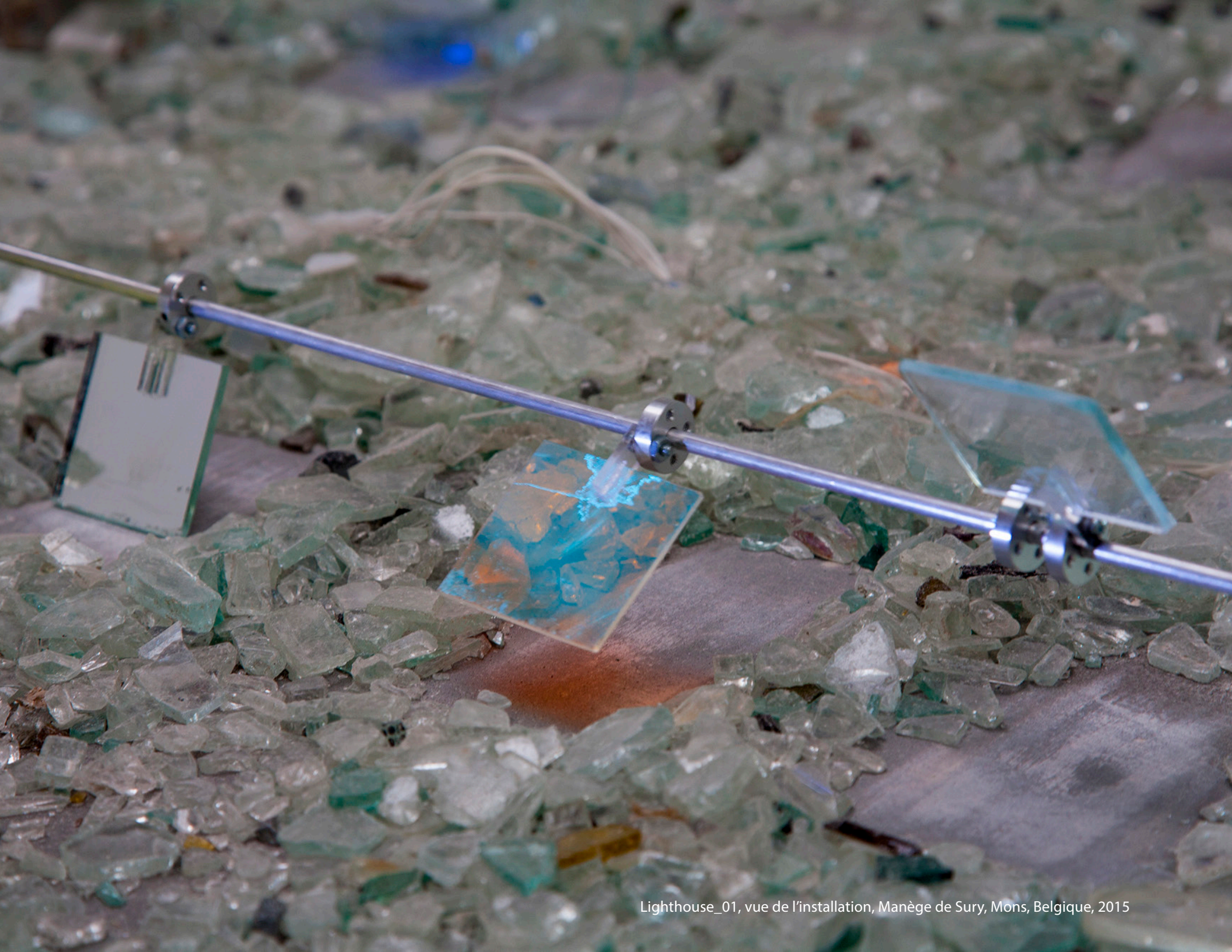
Lighthouse_01, vue de l'installation, Manège de Sury, Mons, Belgique, 2015