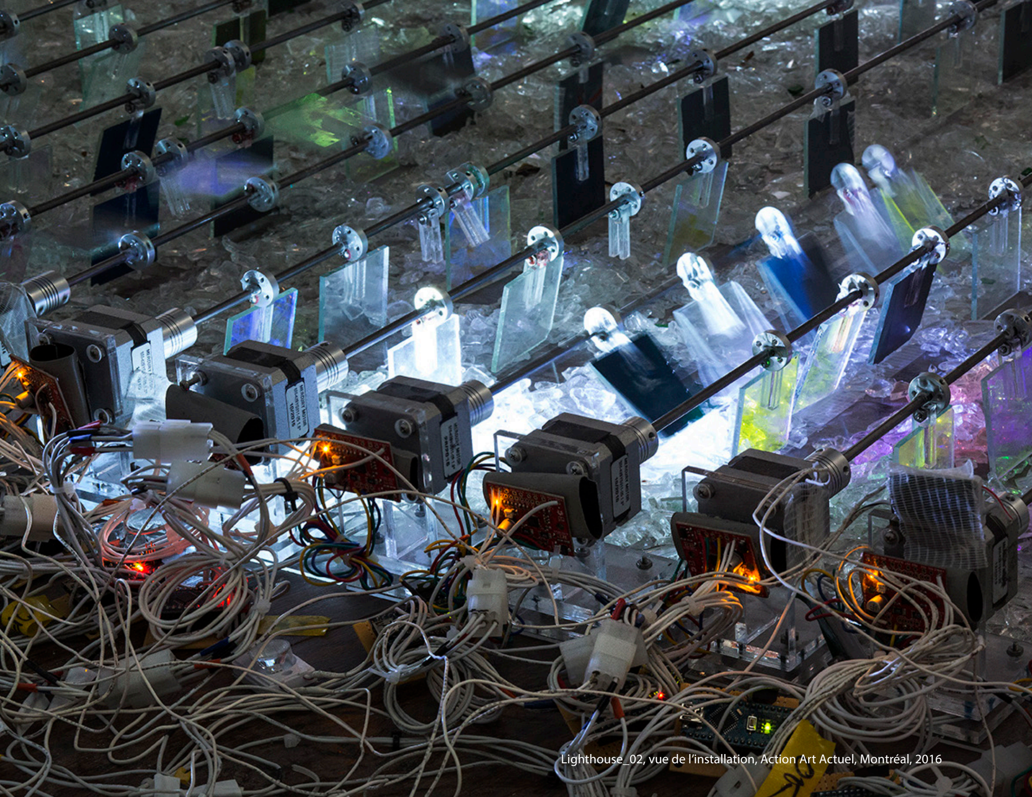
Lighthouse_02, vue de l'installation, Action Art Actuel, Montréal, 2016