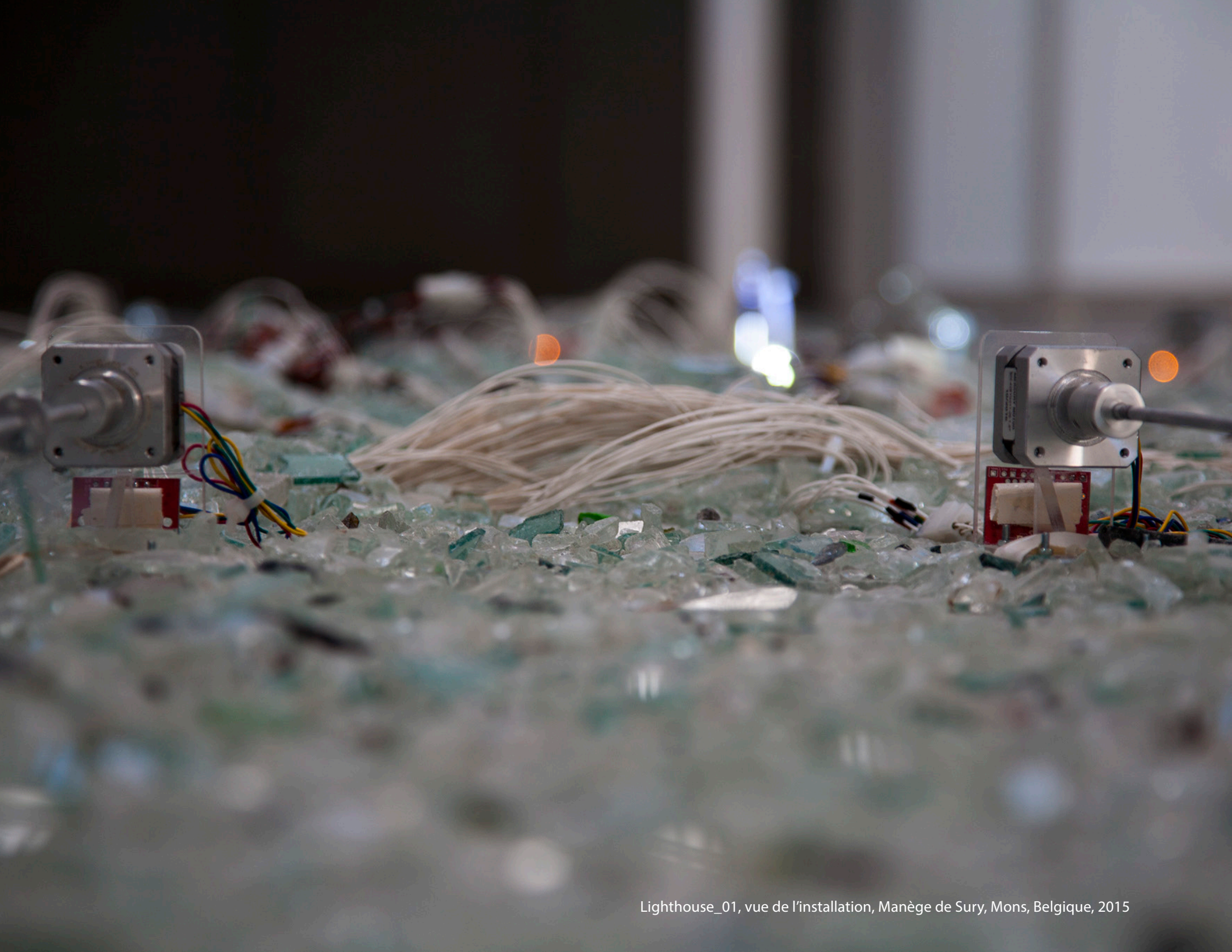
Lighthouse_01, vue de l'installation, Manège de Sury, Mons, Belgique, 2015